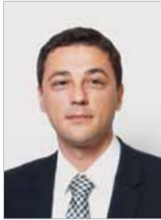
Bozidar Laganin Direttore della SIEPA

“Come una parte completamente integrata nel futuro dell’Europa, il Governo Serbo si concentrerà sulla continuazione dello sviluppo del nostro paese come un ambiente amichevole per gli investitori stranieri. Noi a SIEPA, proseguiamo a lavorare con questi investitori, provvedendo il massimo livello di competenza, di esperienza e il supporto necessario per sfruttare completamente ciò che la Serbia ha da offrire. 2011 promette di essere un’ anno prospero e positivo per la Serbia e vi invitiamo ad unirvi a noi.